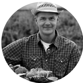
Эксперт предметной области