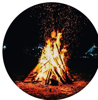
Little Bonfire DATASKAI

Возможность частого обсуждения данных и результатов моделей между DS и экспертами