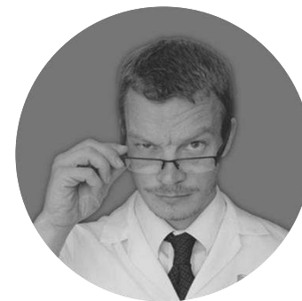
Эксперт по работе с данными

Возможность частого обсуждения данных и результатов моделей между DS и экспертами